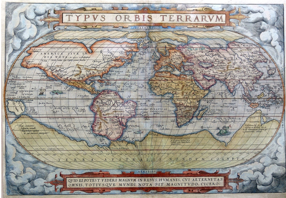
Carte d'Ortelius de 1572.