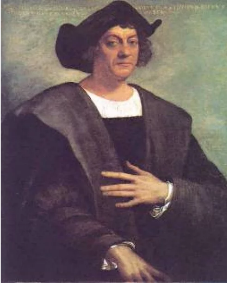
Portrait de Colomb (1451-1506)

Source : Historiek.net : https://historiek.net/christoffel-columbus-1451-1506/2219/