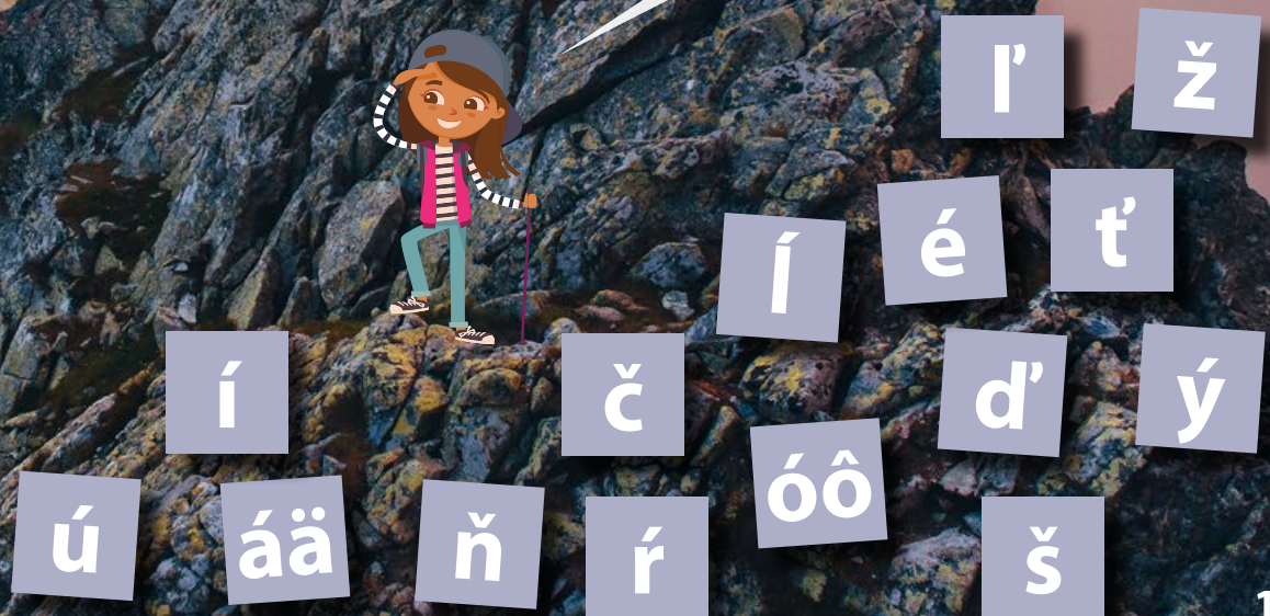
Photo: High Tatras, Slovak Republic