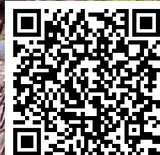
Photo: Ljouwert, Netherlands