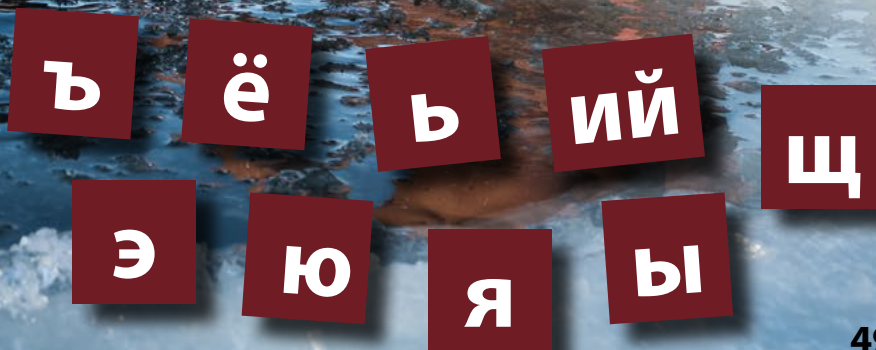
Photo: Swimming in an ice hole, Russia