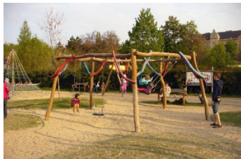
Aire de jeux

Consultez des cartes, les journaux et les sites web locaux, et avec l'aide des enfants de la localité (si possible), établissez une liste des endroits présentant un intérêt et une utilité pour les enfants réfugiés, par exemple :