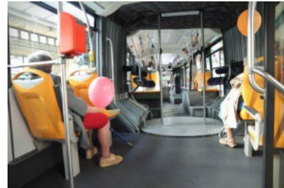
En bus, tram, métro

Formulations utiles pour organiser une sortie : si possible, les enfants de la localité peuvent « apprendre » aux enfants réfugiés les expressions ci-après (et leur demander comment elles se disent en ukrainien) :