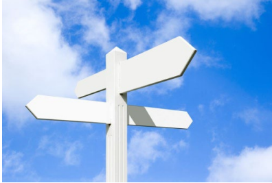
Où allons-nous ?

Abordez les questions suivantes avec votre groupe, si possible ; les enfants de la localité et les enfants réfugiés peuvent échanger par paires ou en petits groupes.