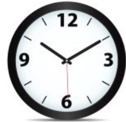
À quelle heure ?