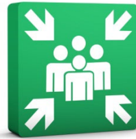
Où nous retrouvons-nous ?